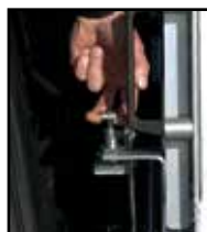
Loquet de blocage de la rampe en position repliée