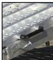
Poignées pour une meilleure préhension