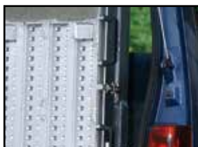
Système d'attache des parties repliables entre elles