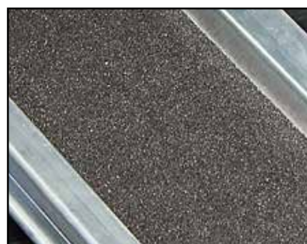
Grip adhésif antidérapant