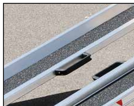
Poignées de préhension fournies d'origine