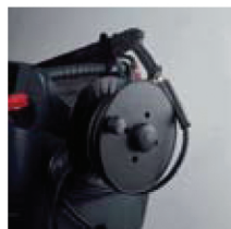
Enrouleur disponible en option