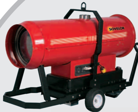
Chassis renforcé optionnel

Le EC110 se caractérise par son brûleur fuel à 2 allures permettant de choisir la puissance délivrée.