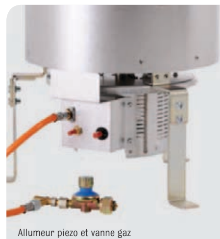
Allumeur piezo et vanne gaz