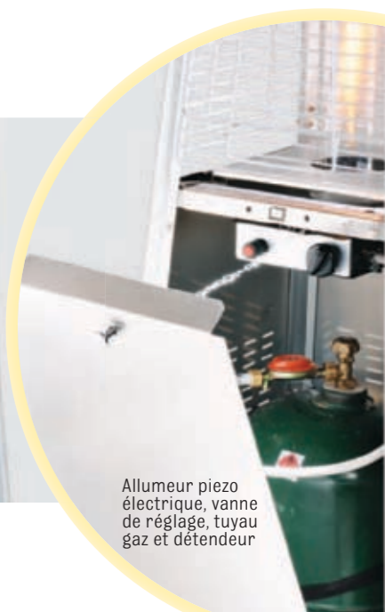
Allumeur piezo électrique, vanne de réglage, tuyau gaz et détendeur