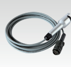
Manuelle RC-HA1 045675