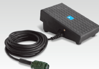
Pédale RC-FA1 045682