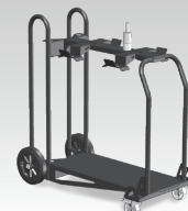
Chariot 10m 3 037328