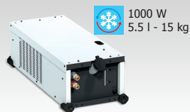
WCU 1kW C 013537