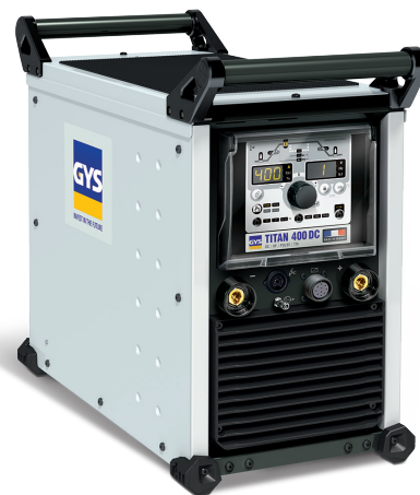
Livré sans accessoires