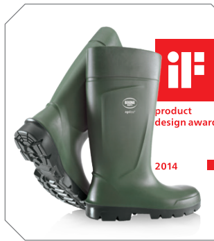
Agrilite® verte - réf. P2400/9180