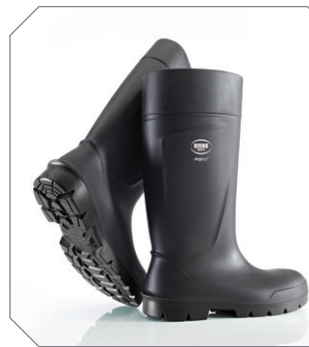
Steplite® noir - réf. P2400/8080

adhérence optimale dans n'importe quelle situation