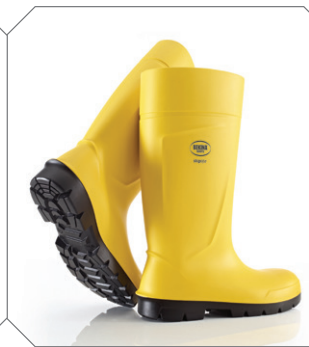
Steplite® jaune - réf. P2400/2080