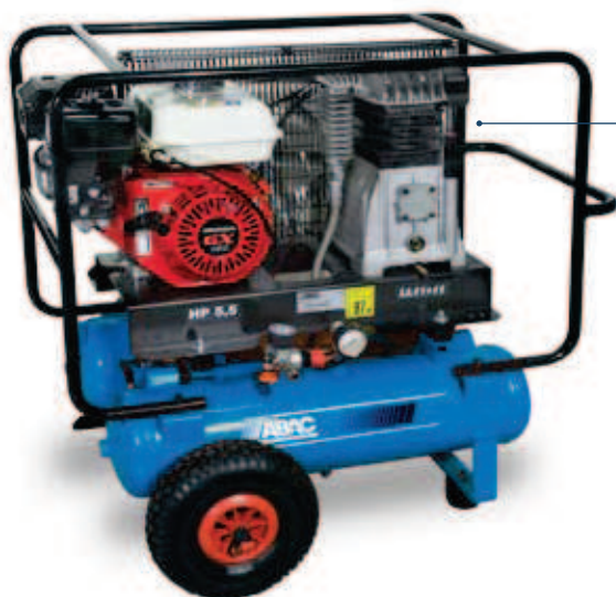
B3800BF/2 x 11 C5