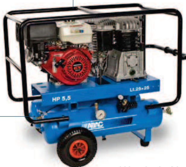
B5900BF/2 x 25 C8