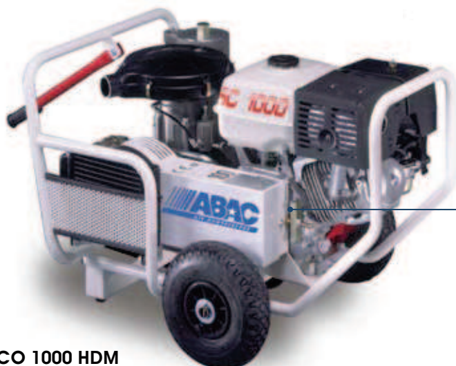
ECO 1000 HDM