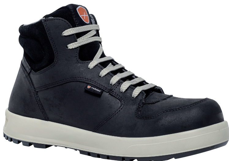
■ 2844 Noir