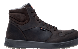
■ 2845 Marron