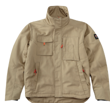
■ 1470 SAND