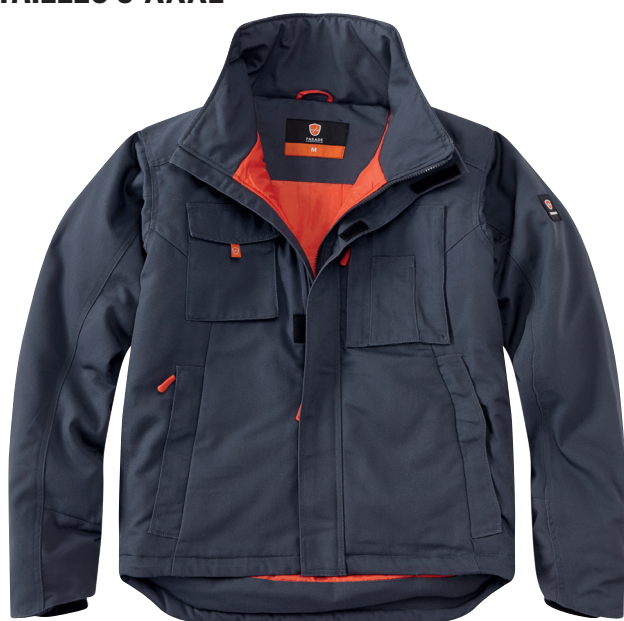
■ 1453 PARADE GREY