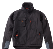
■ 1494 DARK BLACK